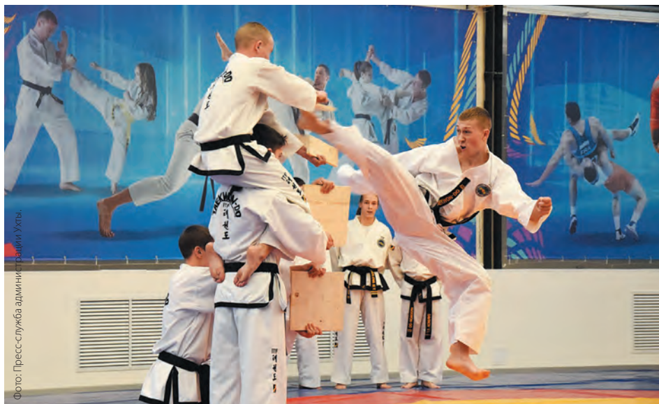
В Центр единоборств имени Эдуарда Захарова функционируют секции греко-римской и вольной борьбы, самбо и карате.