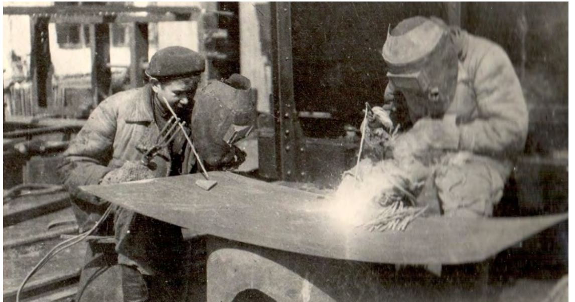
Сварщики Ремонтно-механического завода. 1944 год.

Традиционным нефтяным районам Северного Кавказа, Азербайджана угрожал враг, поэтому ухтинцам необходимо