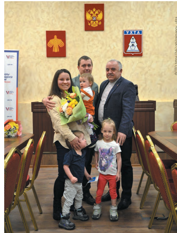
Программа получения выплат на приобретение жилья молодым семьям реализуется в Ухте с 2007 года, за это время выплаты получили 496 молодых семей