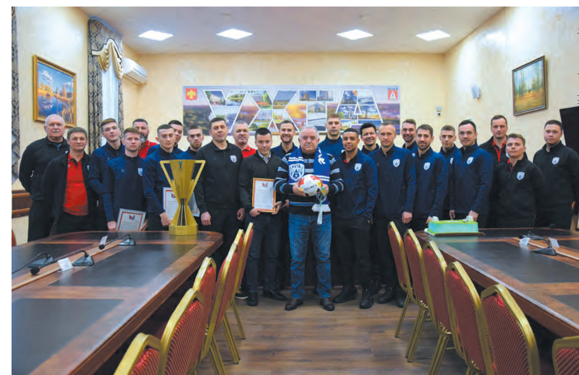
В феврале в администрации Ухты чествовали игроков и тренерский состав мини-футбольного клуба «Ухта», ставшего обладателем PARI-Кубка Лиги сезона 2023/24.