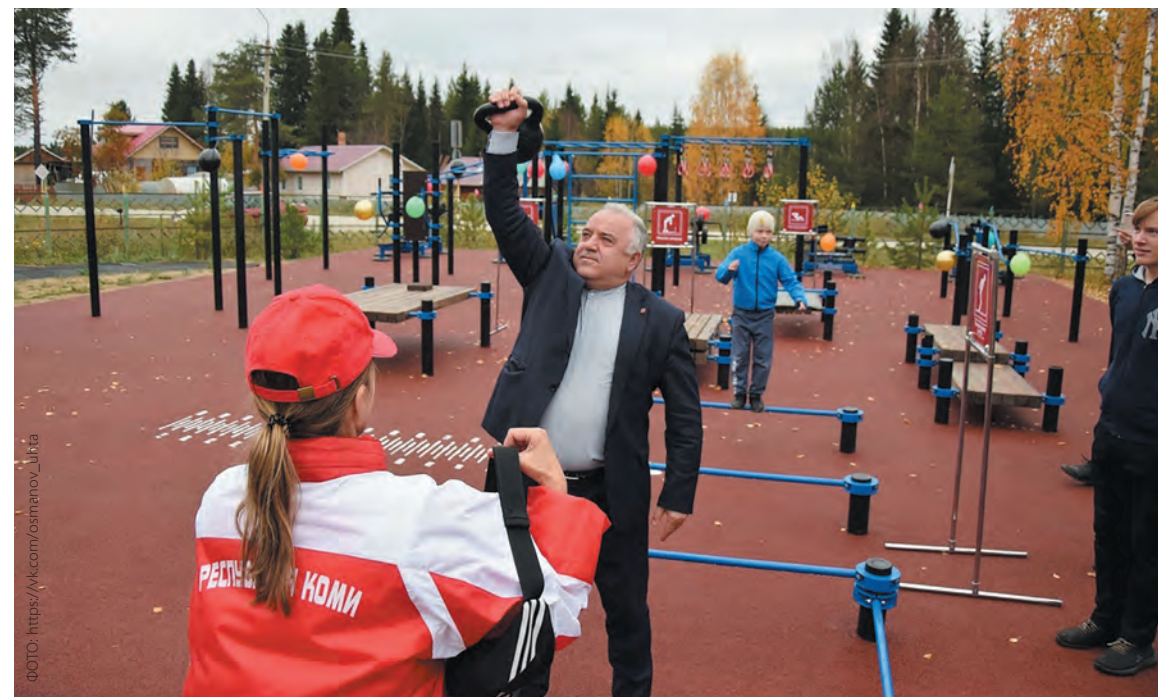
К 80-летию юбилею школы поселка Кэмдин в октябре 2023 года появилась спортплощадка ГТО.