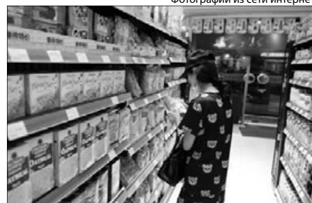
Фотографии из сети интернет

Индекс рассчитывается, исходя из рыночных цен на зерновые, мясо, молочную продукцию, растительное масло и сахар. Все эти компоненты в августе заметно подешевели. Так, по сравнению с июльскими ценами стоимость зерна упала на 7%, растительного масла – на 8,6%, сухого молока, сыров и масла – более чем на 9%. При этом цены на сахар рухнули на 10%. Единственной категорией, устоявшей перед нисходящим трендом, оказалось мясо: цены