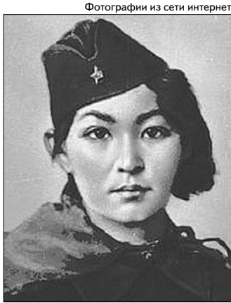
Фотографии из сети интернет