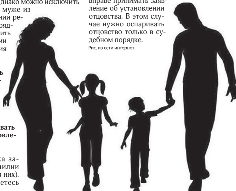
Рис. из сети интернет

Если в свидетельстве о рождении ребенка уже есть запись об отце, сделанная на основании свидетельства о браке или свидетельства об установлении отцовства, то орган загса не вправе принимать заявление об установлении отцовства. В этом случае нужно оспаривать отцовство только в судебном порядке.