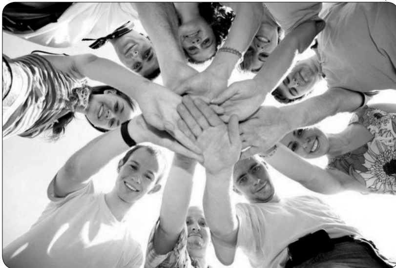
Фото из сети интернет

В социальной сети «ВКонтакте» опубликована весьма, на наш взгляд, поучительная история. Антрополог предложил детям из африканского племени поиграть в одну игру. Он поставил возле дерева корзину с фруктами и объявил, обратившись к детям: «Тот из вас, кто первым добежит до дерева, удостоится всех сладких фруктов». Когда он сделал знак детям начать забег, они накрепко сцепились руками и побежали все вместе, а потом все вместе сидели и наслаждались вкусными фруктами. Пораженный антрополог спросил у детей, почему они побежали все вместе, ведь каждый из них мог насладиться фруктами лично. На что дети ответили: «Обонато». Разве возможно, чтобы один был счастлив, если все остальные грустные? «Обонато» на их языке означает: «Я существую, потому что мы существуем».