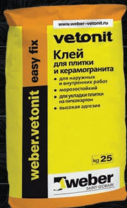
Клей для плитки