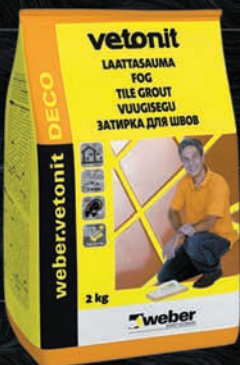
Затирка для плитки