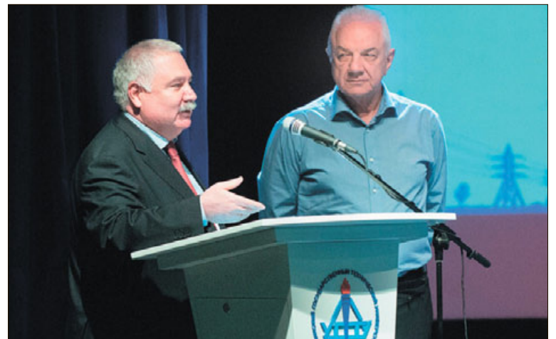
Торжественное закрытие Дней ЛУКОЙЛа в УГТУ.

— Только полное взаимопонимание позволяет нам добиваться таких хороших результатов в совместной работе с УГТУ. Мы всегда рады высокопрофессиональным выпускникам университета на нашем предприятии. Спасибо за тёплый приём, организацию Дней ЛУКОЙЛа в УГТУ. Наше сотрудничество будет продолжаться на самом высоком, добром, позитивном уровне», — заверил собравшихся член попечительского совета университета.